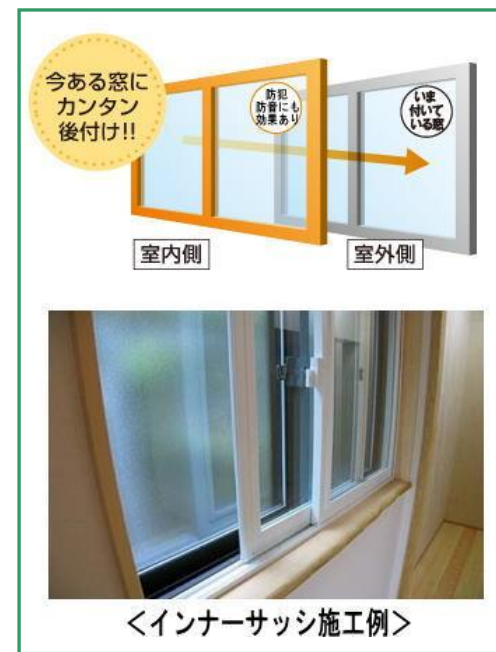
<インナーサッシ施工例>