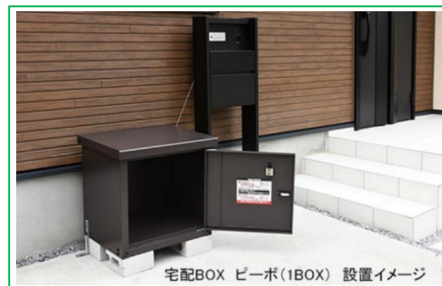
宅配BOX ビーボ(1BOX) 設置イメージ